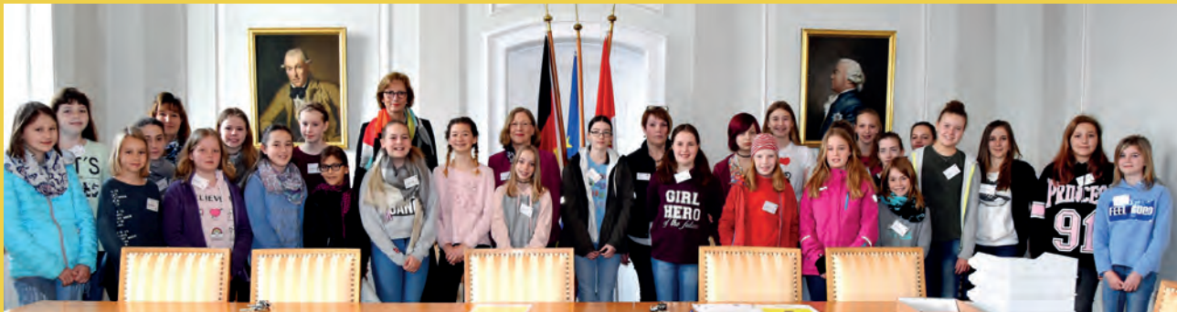
Frau Lindscheid und die interessierten Besucherinnen beim „Girls’ Day“

Falls noch nicht ganz klar ist, wo es beruflich hingehen soll, kann ein Studienpraktikum oder ein Schulpraktikum hilfreich sein. Oder Du besuchst uns bei allgemeinen Info-Veranstaltungen wie z. B. dem „Tag der offenen Tür“ oder dem „Girls’/Boys’Day“! Auch das Europe Direct im RP Darmstadt bietet die Möglichkeit für studentische Pflichtpraktika.